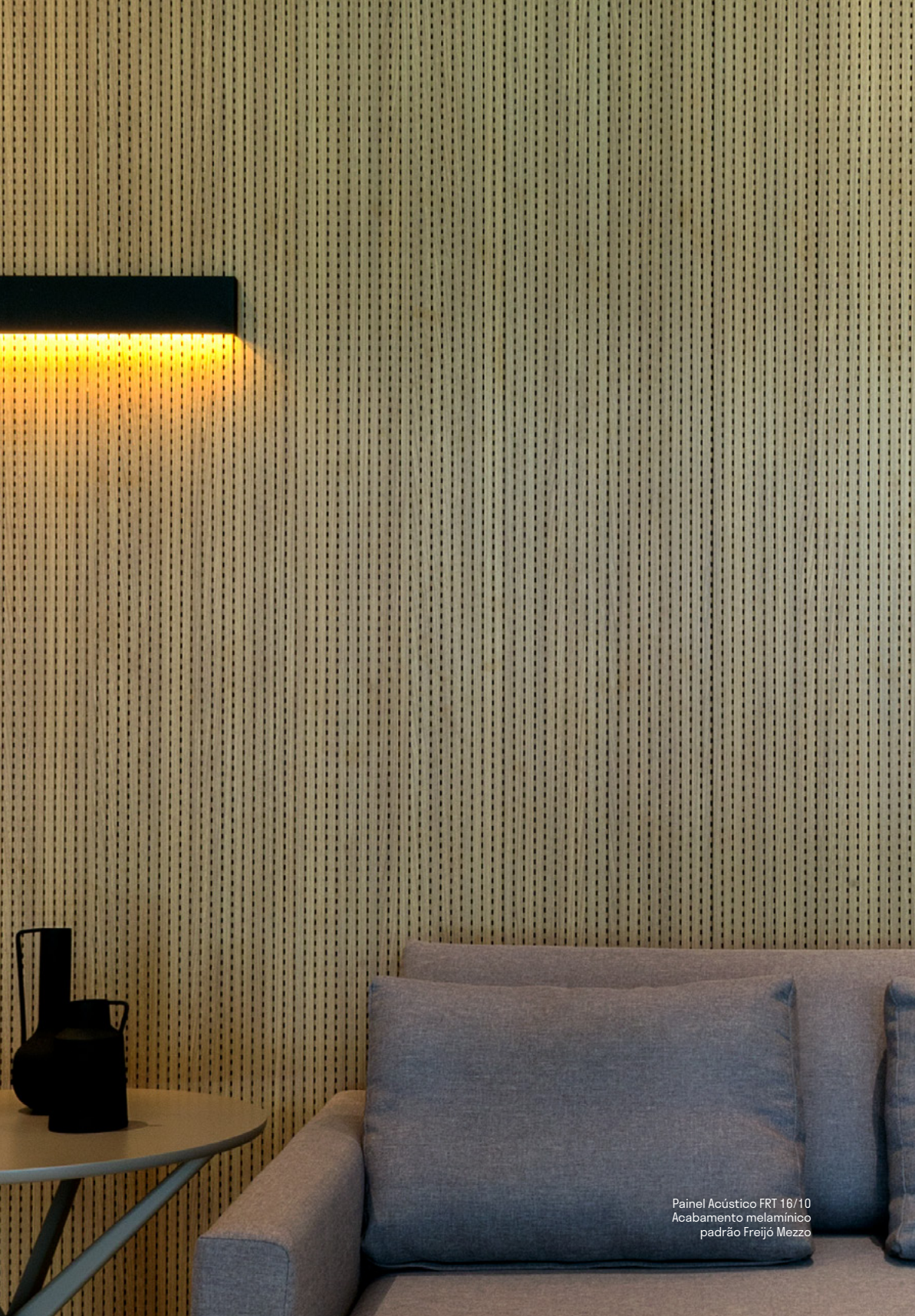
Painel Acústico FRT 16/10 Acabamento melamínico padrão Freijó Mezzo